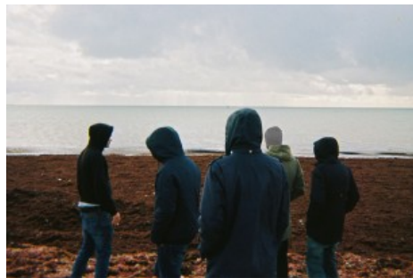
FAUVE qui peut !