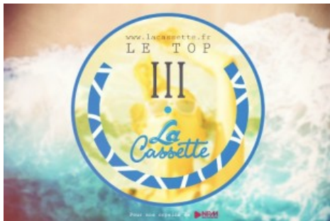
Now Playing x La Casette : Le Top 3 de Décembre