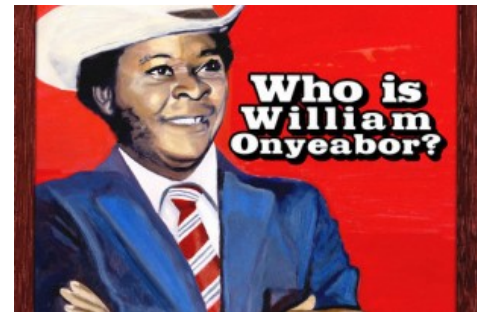
Le mystère William Onyeabor résolu